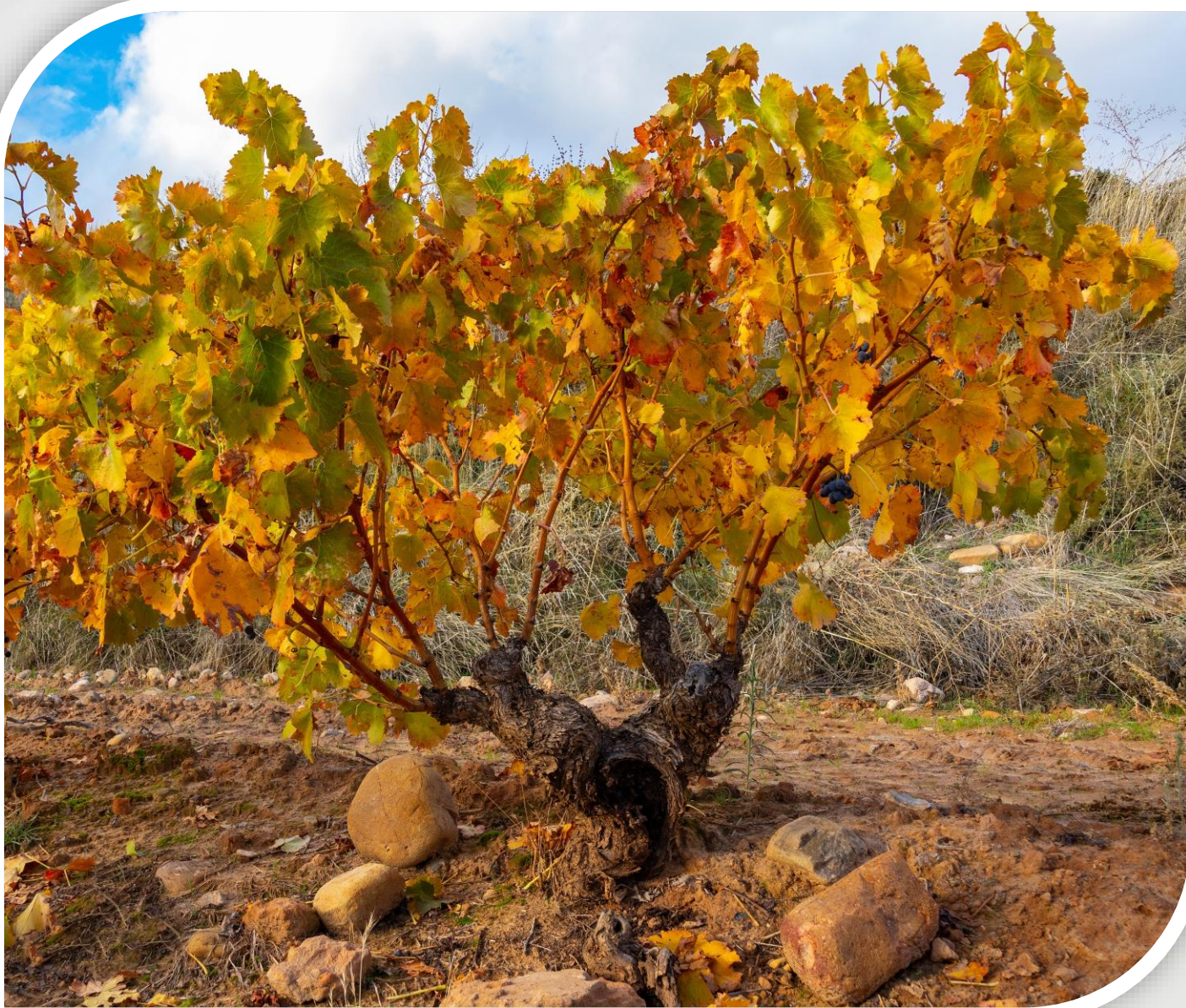
IMAGEN: Jaime Arechavaleta